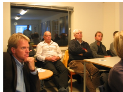
Nytt segel, men till fock eller storsegel?