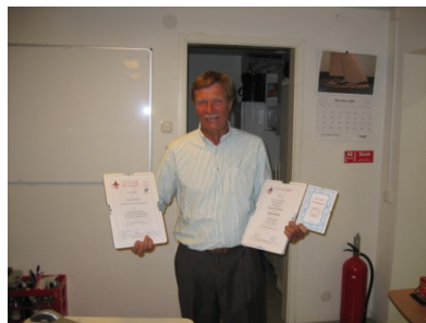
Efter kvällen hedersmedlem i - Cumulusklubben - Albin 78 klubben - Stratusklubben