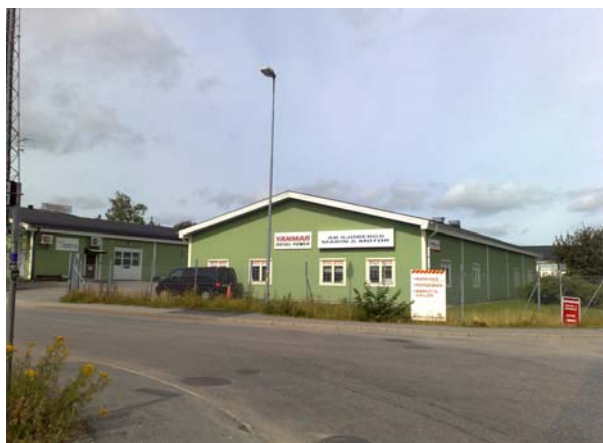
AB Sjöbergs Marin & Motor Fräsarvägen 2, 142 50 SKOGÅS 08-6090800